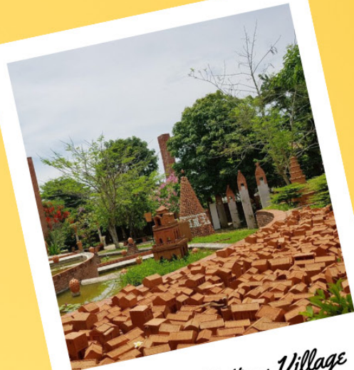
Thanh Ha Pottery Village

The Thanh Ha pottery village boasts a history spanning over 500 years. Even today, Thanh Ha village continues to perpetuate traditional production methods, a splendid combination of meticulous craftsmanship and the preservation of the intrinsic values of national art.