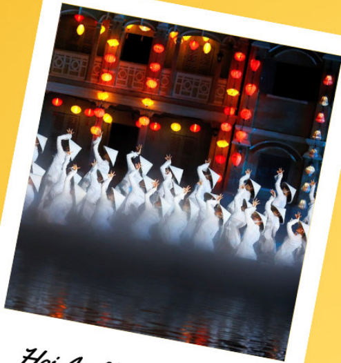
Hoi An Memories Show