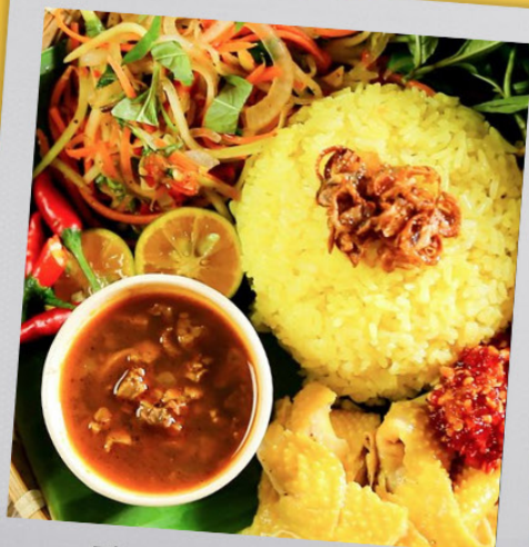
Bà Buội Chicken Rice