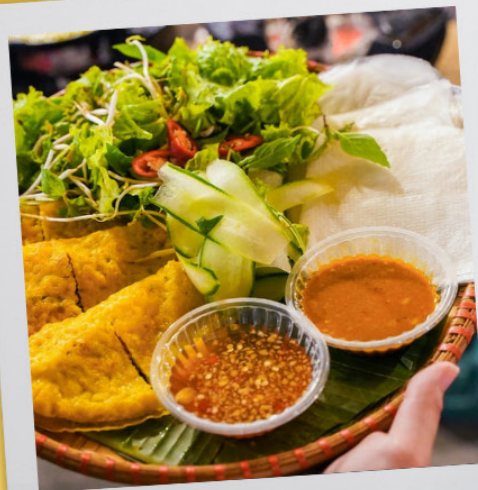
Bánh Xèo Giếng Bá Lễ

Bà Buội Chicken Rice is a long-established restaurant with a renowned chicken rice dish that delights even the most discerning customers.