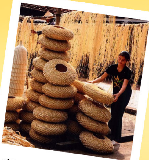
Hoi An Handicraft Workshop