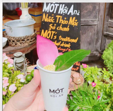
Mot Hoi An